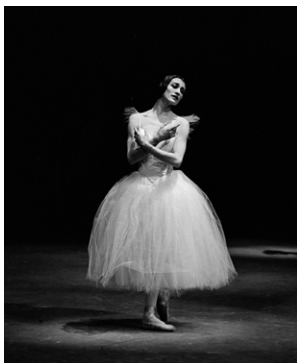
Carla Fracci interpreta 'Giselle' in scena nel 1964

nel corso della cerimonia finale del 31° GrandPrix Advertising Strategies . L'edizione 2018 dell'evento, organizzato da TVN Media Group e dedicato alla strategia di marca, ha deciso di omaggiare Carla Fracci con un riconoscimento che celebra il percorso di questa straordinaria artista, che è stata interprete d'elezione dei grandi balletti romantici e di nuove versioni dei classici e che ha comunicato un'idea di danza democratica portando