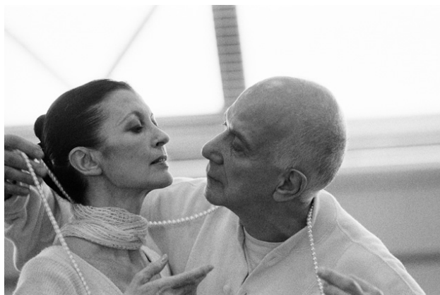
Carla Fracci con il coreografo e danzatore francese Roland Petit

Il suo nome è sinonimo di danza. In Italia, dove è stata figura cardine del Teatro alla Scala di Milano, e nel mondo, dove ha costruito una carriera che ha toccato i principali palcoscenici del balletto classico. Carla Fracci , l'étoile italiana parte della storia culturale del nostro Paese fatta di arte e bellezza, calcherà il Teatro Nazionale di Milano il prossimo 21 maggio per ritirare il Premio 'Comunicazione e Danza'