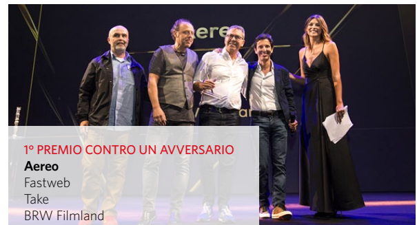
1° PREMIO CONTRO UN AVVERSARIO Aereo Fastweb Take BRW Filmiland