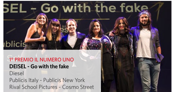
1° PREMIO IL NUMERO UNO DEISEL - Go with the fake Diesel Publicis Italy - Publicis New York Rival School Pictures - Cosmo Street