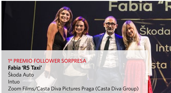
1° PREMIO FOLLOWER SORPRESA Fabia 'R5 Taxi' Škoda Auto Intuo Zoom Films/Casta Diva Pictures Praga (Casta Diva Group)