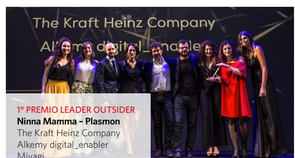
1° PREMIO LEADER OUTSIDER Ninna Mamma - Plasmon The Kraft Heinz Company Alkemy digital_enabler Miyagi