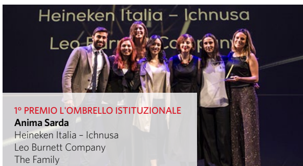
1° PREMIO L'OMBRELLA ISTITUZIONALE Anima Sarda Heineken Italia - Ichnusa Leo Burnett Company The Family