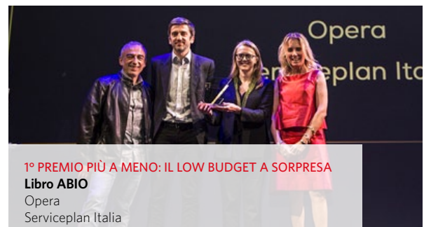
1° PREMIO PIÙ A MENO: IL LOW BUDGET A SORPRESA Libro ABIO Opera Serviceplan Italia