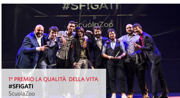
1° PREMIO LA QUALITÀ DELLA VITA #SFIGATI ScuolaZoo