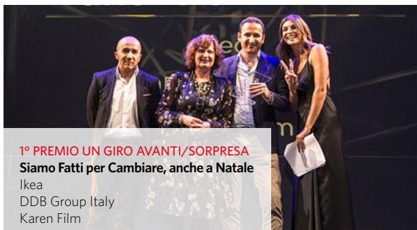
1° PREMIO UN GIRO AVANTI/SORPRESA Siamo Fatti per Cambiare, anche a Natale Ikea DDB Group Italy Karen Film